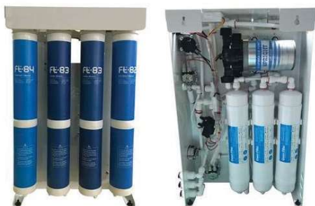
Osmose semi industrial CP-600