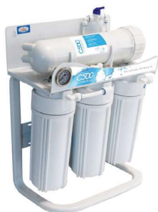
Osmose semi industrial C-500