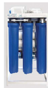
Osmose semi industrial C-1200