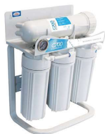
Osmose semi industrial C-700